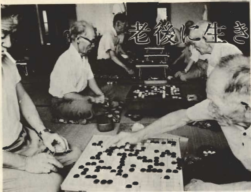
↑老後を趣味にすこす人たちは—8月10日、老人福祉センターで、趣味クラブの囲碁大会

老人クラブとは、孤独感や欲求不満を 持ちやすい老人が、レクリエーション、 趣味、教養の向上、地域との交流、健康 管理の五つの活動を通じ、老後の生きが いを見つけていくことと自主的に組織した 団体です。