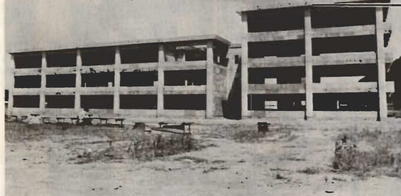
↑4月に工事が始まった第一中学校の防音校舎。全建築面積4470㎡のうち64%の3008㎡の外装工事が完成・9月から内装工事にかかります。