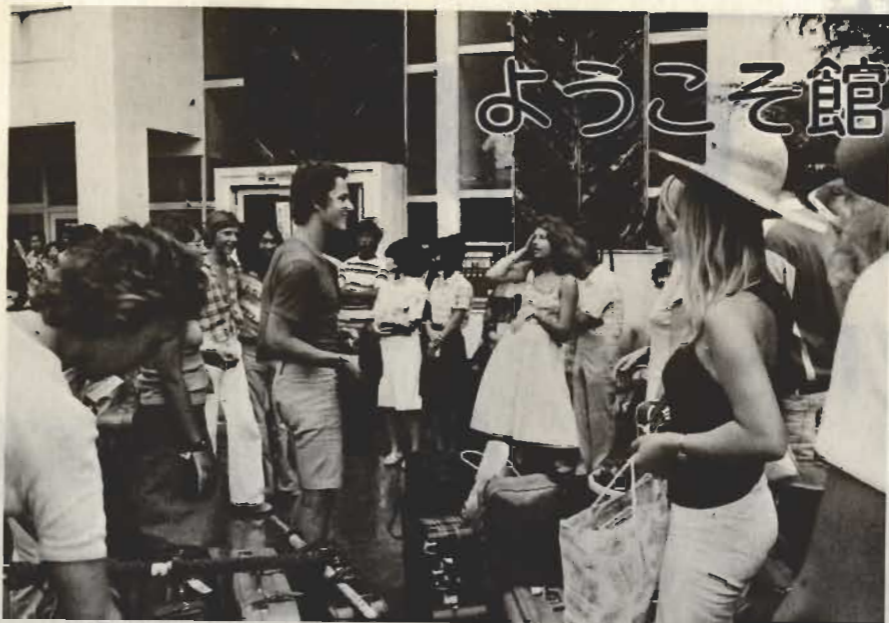
↑8月7日、親善交流のため来館したドイツユーゲントのみなさん=市民センターで=

姉妹都市の米国ベリンハム市と西ドイツから、このほど相ついで親善使節団が来館。期せずして、真夏の房州に国際親善の花を咲かせました。