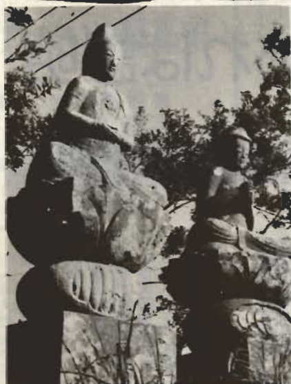
↑九重の竹原にある大日如来

九重の竹原、青年館から東へ約300m行った小高い丘の上に、下を見おろすように二つ並んでたっているのがこの石仏。これは出羽三山の信仰にからんでつくられました。