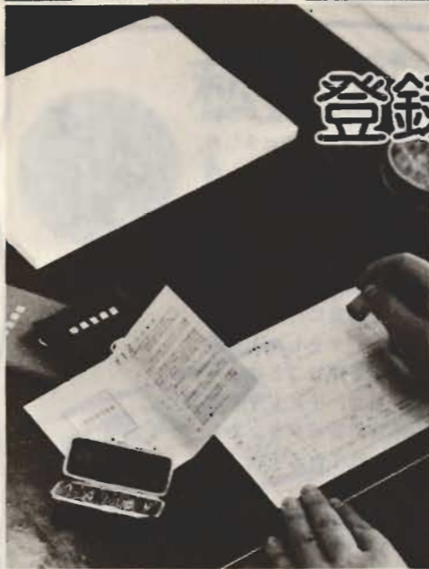
登録替えした人に発行される登録証。