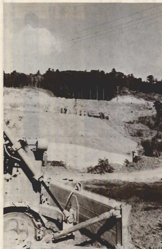
↑水不足の解消めざし工事が進められている作名ダム

また、市民体位の向上、健康の増進を図るため市民参加による総スポーツ運動の推進とスポーツ文化の普及に努めたい考えです。このため、市の体育スポーツ施設の利用並びにスポーツグループの自主的運営を推進し関係団体における指導者の育成と組織の強化をすすめる一方、健康は自らの意志で獲得していくという姿勢で家族ぐるみで楽しめる明るいスポーツの振興を促進したい考えです。また、かねて第一中学校に建設中の第一柔剣道場もようやく完成したので、これが利用促進について、広く一般市民に開放したい考えです。