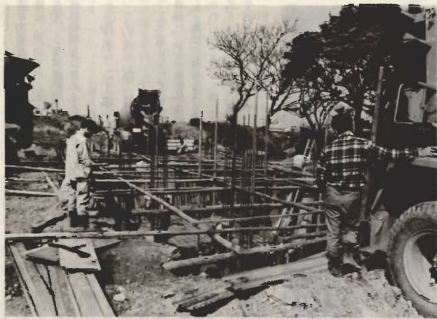
↑寝たきり老人の完全看護を目的につくられている特別養護老人ホーム

から要望のありました乳児保育所が四月から北条地区の中心に開設の運びとなり、これをもつて全地域に保育施設が完備され