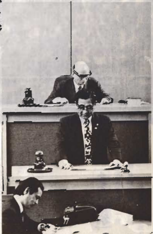
↑3月議会で施政方針をのべる市長

本年度は、富崎小学校のプール建設と船形小学校の運動場整備関係費を計上しました。また、市内の学校の大部分は、現在、