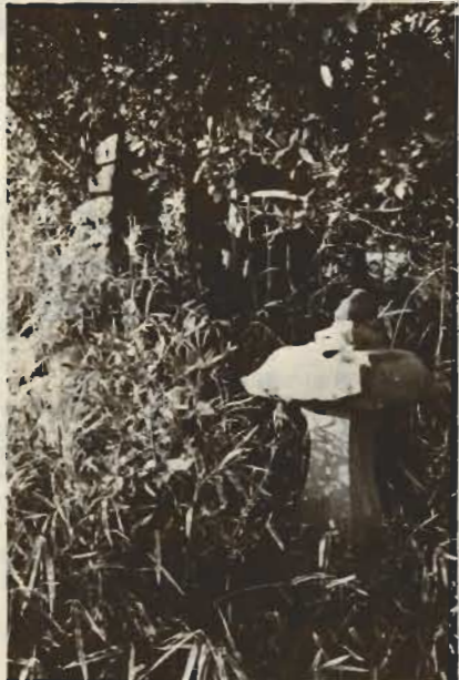
↑那古山山頂にある和泉式部塚