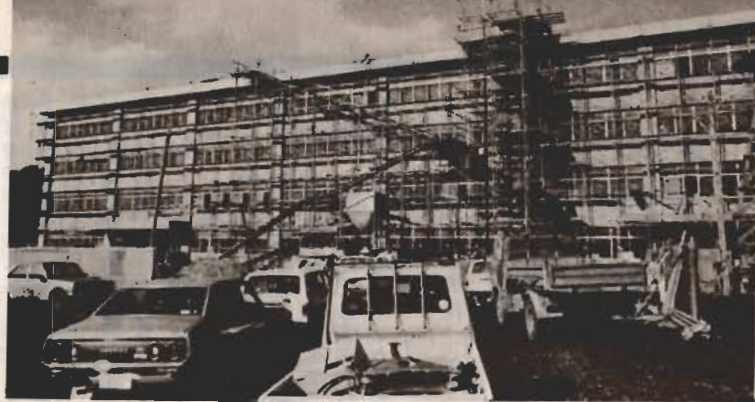
↑3月末で内装工事の終る第二中学防音校舎。全工事は51年度に完成予定。

市では学校、庁舎、市民センターなどの建物、土地、車、有価証券などの財産を持っています。