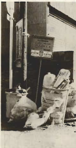
↑ゴミを出す場所はいつもきれいにしましょう。

空かんやビンなどは絶対に入れないでください。 ▽缶、ビン、ガラスなど危険物は必ず、ダンボールか丈夫な袋に入れ、不燃物収集日に出してください。パラパラのときは取り残す場合があります。 また、大きなごみはできるだけこわして、始末しやすくしてください。 ▽ごみ容器が道路へはみ出して置いてあるところがあります。交通の妨げになっては大変です。容器をボンと置く前に、人に迷惑をかけないかどうかを考え、