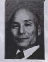
諸施策の 実現に努力