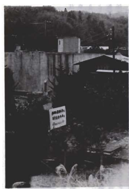
▲四月一日付で移管される房州水道事業の現場

農林水産業費では、生産意欲の向上と優良水田確保のため、水田休耕地復旧対策事業補助金に一一七万四千円、基盤整備をした布沼、上郷地区内の排水路工事関係として自然休養村は場