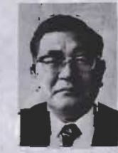
みなさんとともに