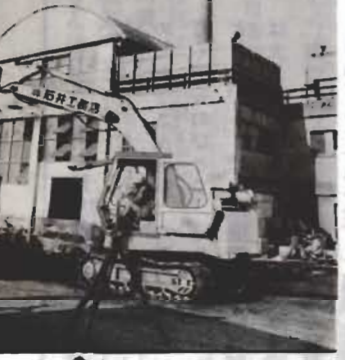
↑炉の増設工事が始まった正木ごみ処理場

第三回臨時市議会が十一月八日開かれ、二中防音校舎内装工事、正木ごみ処理場増設工事など三議案が可決されました。 ▽二中防音校舎の内装に二億円 防衛庁の補助を受け新築工事が進められている市立第二中学校の防音校舎の第一期内装工事を、二億三千万円で進めたいと、今回の工事は全体の六六・九九平方メートルの五二%にあたる三四五平方メートルの増設工事が始まった正木ごみ処理場