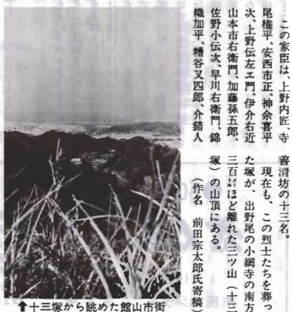
↑十三塚から眺めた館山市街

一月三日までは収集は休みませんが焼却作業は休みません。この間のごみは正木処理場に直接お持ちください。手数料は百詰まで無料、それ以上は百詰まで五十円です。 ▽ご用心 最近、市職員だといつわって各家庭をまわりごみ容器を売り歩いている者がいますが、市とはいっさい関係ありません。 市では、ごみ容器の販売はしていませんのでご注意ください。