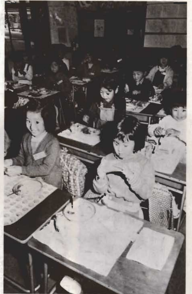
激しい物価上昇は子どもの給食にまで及んでいます。