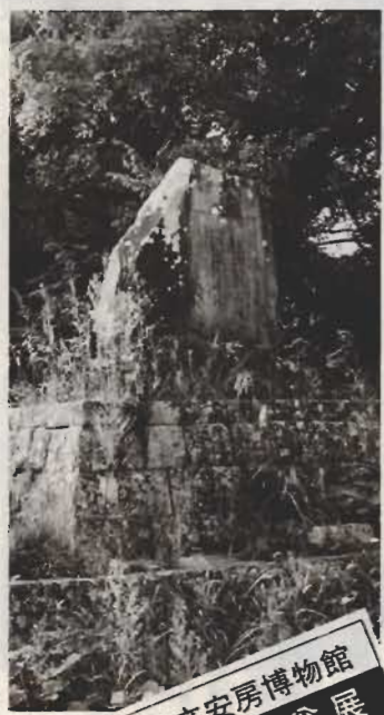
県立安房博物館 武田石翁展

後記によると昔ここに伴直家主(とものあたいやかぬし)という人がいた。承和三年(八三六年)に彼の親が亡くなったとき、家主は深く悲しみ、墓をたてて生前仕えたと同じように仕えた。それをきいた朝廷は家主を孝行な子として表彰した」という意味のことか書かれています。