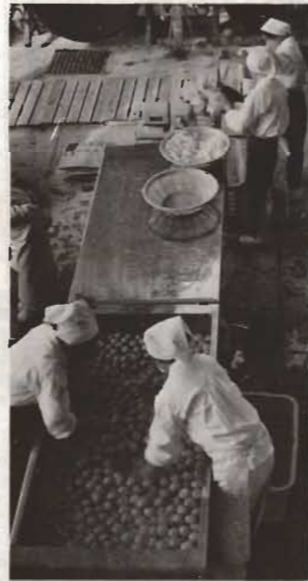
安く栄養のある給食をつくるのにセンターは四苦八苦。

しかし今の物価上昇が続けば来年度あたり改正もやむをえないといっています。また一部の自治体で行っている値上げ分を公費で負担してもらうことは、考え方はよいが、なかなか実現できないそうです。いずれにせよこの問題を解決するには何よりも国がもっと、現場の実情を理解し、抜本的な対策をたてる必要があります。すべてを市町村に押しつけている限り、そのしわ寄せは結局、自治体や父兄にやってきます。未来をにやう子どもたちの「食」