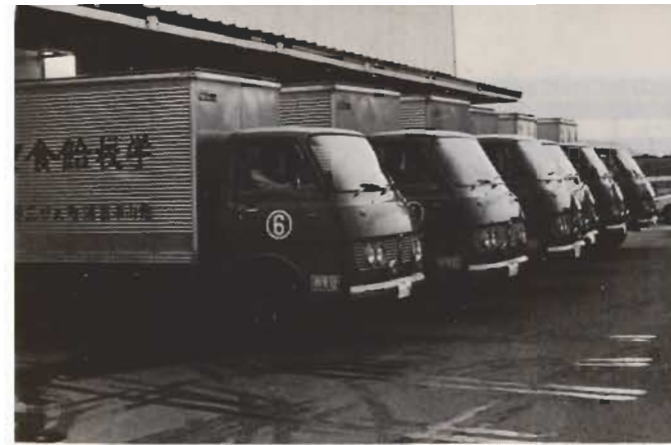
毎日子どもたちに給食を届けるコンテナ車。

る前は、館山小学校、那古小学校、富崎小学校、豊房小学校の四校が単独で給食を行っていました。全国的な学校給食の普及率は小学校が九三%、中学校は八三%。今では、学校給食は子どもたちにとって空気のような存在