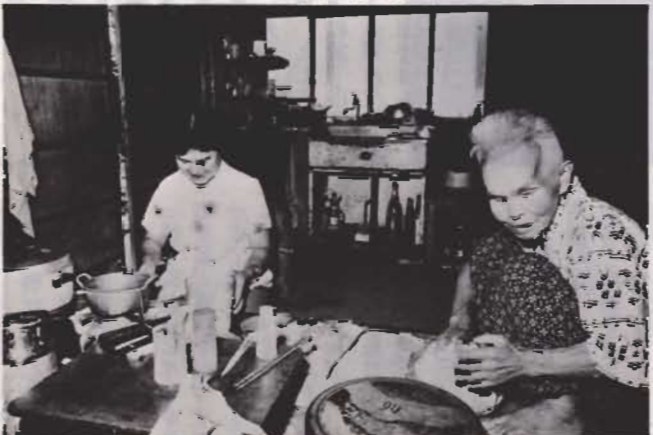
「もっと砂糖を入れたほうがいいんじゃないかね」「ううんこれぐらいがおいしいのよ」 昼食の準備もいっしょに。