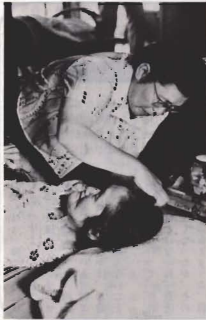
「おばあちゃん髪をとくしましょうね」

9月15日は敬老の日。元気なお年寄りは敬老会などの楽しい行事に参加できます。しかし、一人寂しく寝たきりのお年寄りもたくさんいます。 市は、老衰、心身の障害などのため日常生活が不自由なお年寄りや身体障害者に少しでも明るい生活を送っていただくよう家庭奉仕員（ホームヘルパー）を派遣しています。 ホームヘルパーは、老いで孤独になりがちなお年寄りの話し相手になり、掃除、洗たくなど身の回りのお世話をし、不自由なお年寄りの手足となって働いています。待ちわびているお年寄りのため、ホームヘルパーは雨の日も風の日も歩きます。