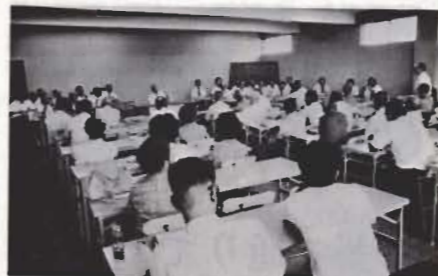
↑8月26日行なわれた「北条地区市民の要望をきく会」