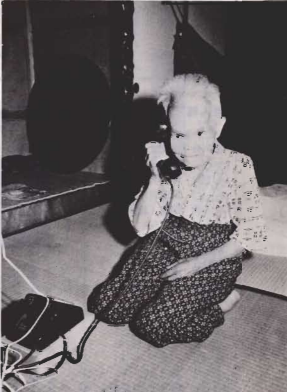
一人暮らしの老人が、イザというとき使う敬老電話。協力者宅と連絡がとれるようになっている。

9月15日は敬老の日。元気なお年寄りは敬老会などの楽しい行事に参加できます。しかし、一人寂しく寝たきりのお年寄りもたくさんいます。 市は、老衰、心身の障害などのため日常生活が不自由なお年寄りや身体障害者に少しでも明るい生活を送っていただくよう家庭奉仕員（ホームヘルパー）を派遣しています。 ホームヘルパーは、老いで孤独になりがちなお年寄りの話し相手になり、掃除、洗たくなど身の回りのお世話をし、不自由なお年寄りの手足となって働いています。待ちわびているお年寄りのため、ホームヘルパーは雨の日も風の日も歩きます。