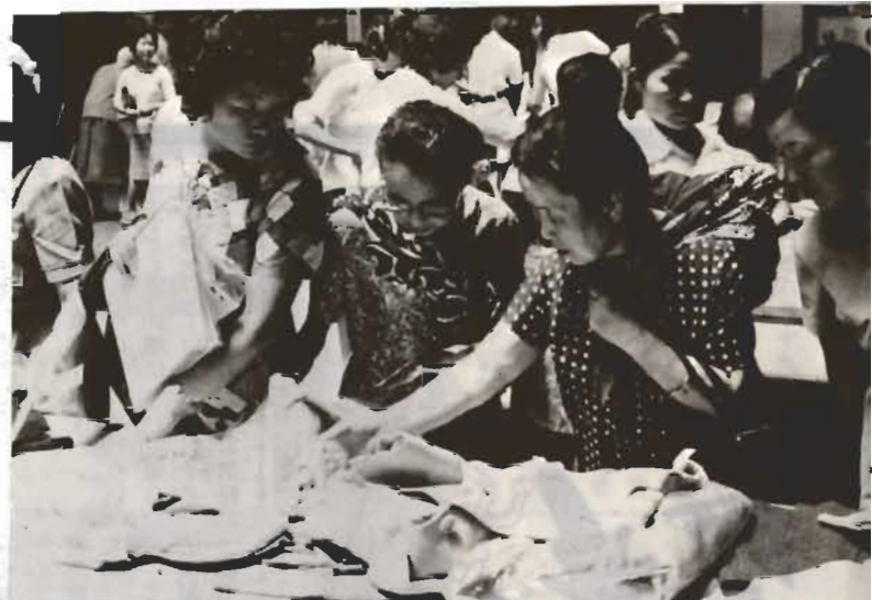
↑6月30日、市民センターで行なわれた不用品交換会。2000点の出品に約1000人の方が殺到し、30分もたたないうちにほとんどの品が売切れ。庶民がいかに物価高に苦しんでいるかを物語っていました。