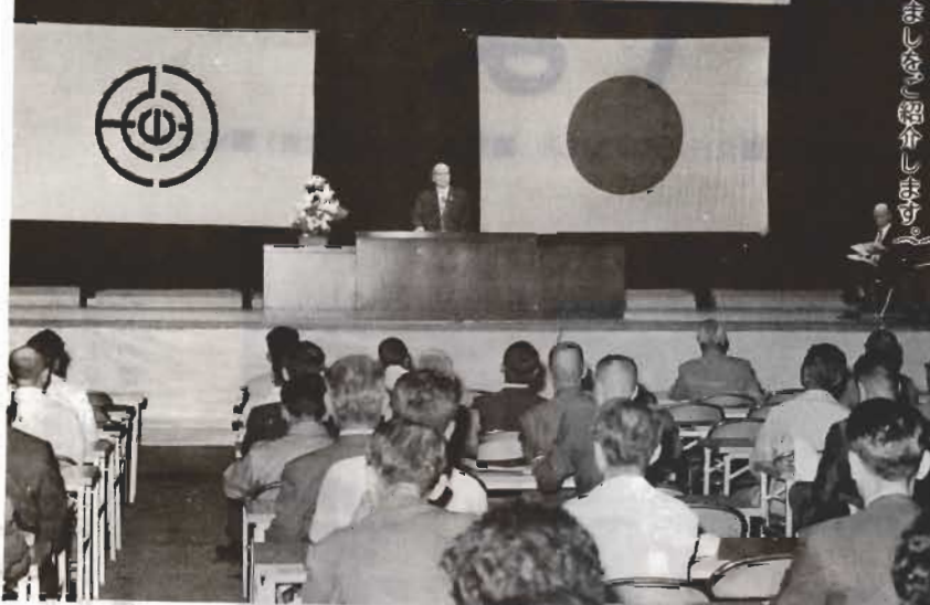
のあらましを、紹介します。