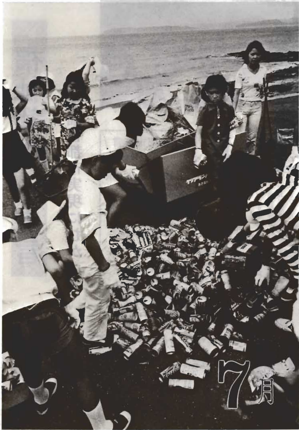
「ワー、こんなに集まった」本格的な海水浴シーズンを前に、さる七月十日、東小学校の生徒百人が海岸に捨てられた空きかん回収作戦を展開しました。購買意欲をかきたてるメーカーの宣伝、おしよせる観光客、むさうさに捨てられるゴミ……。ボクたちの遊び場である美しい海岸をもうこれ以上よこさないで！子どもたちの声は切実です。(写真は西岬海岸で)