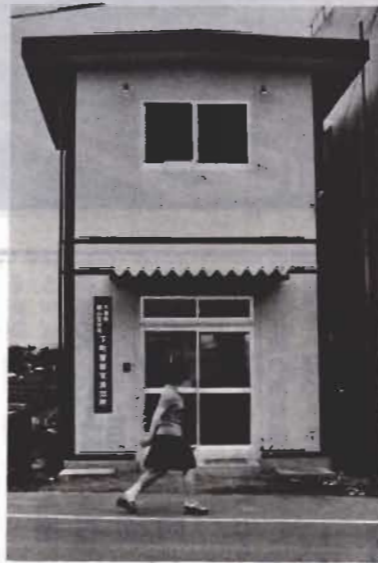
↓このほど汐留橋ぎわにある下町交番が新築されました。規模は鉄筋プレハブ2階建て、66平方メートル。地域の防犯活動の拠点として活躍します。

長須賀第三町内会交通安全クラブの集まりが六月九日、来福寺境内でありました。三歳から小学六年生までの手と父兄約百人が参加、自転車の乗り方や交通ルールなどを、市の交通安全課のおねえさんたちと楽しく勉強しました。