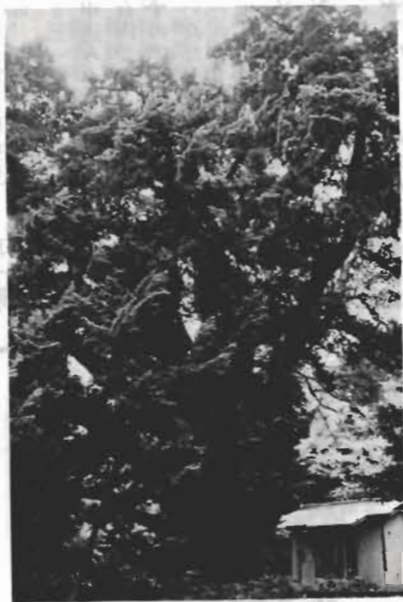
↑樹齢800年の沼のびやくしん

とき配偶者、扶養義務者の状況をあわせて届けてください。 届けが遅れると九月六日の支払い日に福祉年金が受けられなくなりますので、忘れずに届けましょう。 福祉年金は所得が一定額以上あるときは、支給がとめられますが、この所得の限度額は毎年引き上げられていますので、いままで所得が多くて受けられなかった人でも、ことしから受けられるようになる場合もあります。詳細をおたずねください。