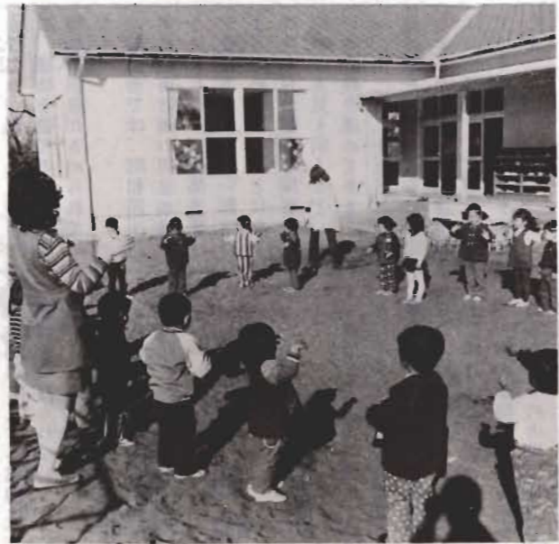
↑ 昭和47年9月に完成した房南保育園

◆市債の状況 市債とは、大きな建設事業などを実施するため、大蔵省資金などを活用する。運用部、郵政省簡易保険局などから借り入れた資金で、十一月三十日現在で総額七億七、〇〇〇万円になっています。