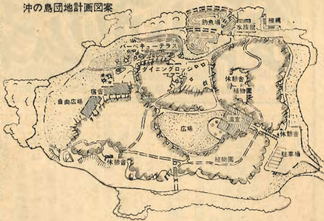
沖の島団地計画図案

国立、国定公園の利用者は一は年々ウナギのぼりにふえ最近では年間一億人にもほるといわれ、その上利用者は勤労青年、学生、一般勤労者、家庭の主婦など広く国民の各階層におよんでいます。この事実は、近年の生活の向上からレジャーを有効に楽しもうとする傾向が普及したことと、都市人口の異常なふくれあがり、そして社会生活が複雑化したため一般大衆のレクリエーションが高まったといわれています。またこうした傾向は決して単なる一時的ブームではなく、我が国の経済成長、産業の合理化などが進むにつれて今後ますます国民生活にならざるを得ないものと考へられています。ところが、国立、国定公園の施設やその整備は不十分で