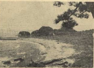
(建設地の富崎海岸)

なお、ユース・ホステルの入口に「布良海岸の児童遊園」が設けられ、布良方面の子供達を始め同地を訪れる青少年の憩いの場ともなります。この遊園地内に、五十年前に亡くなった、明治洋画壇の鬼才青木繁西伯の記念碑を建て、事も計画されています。