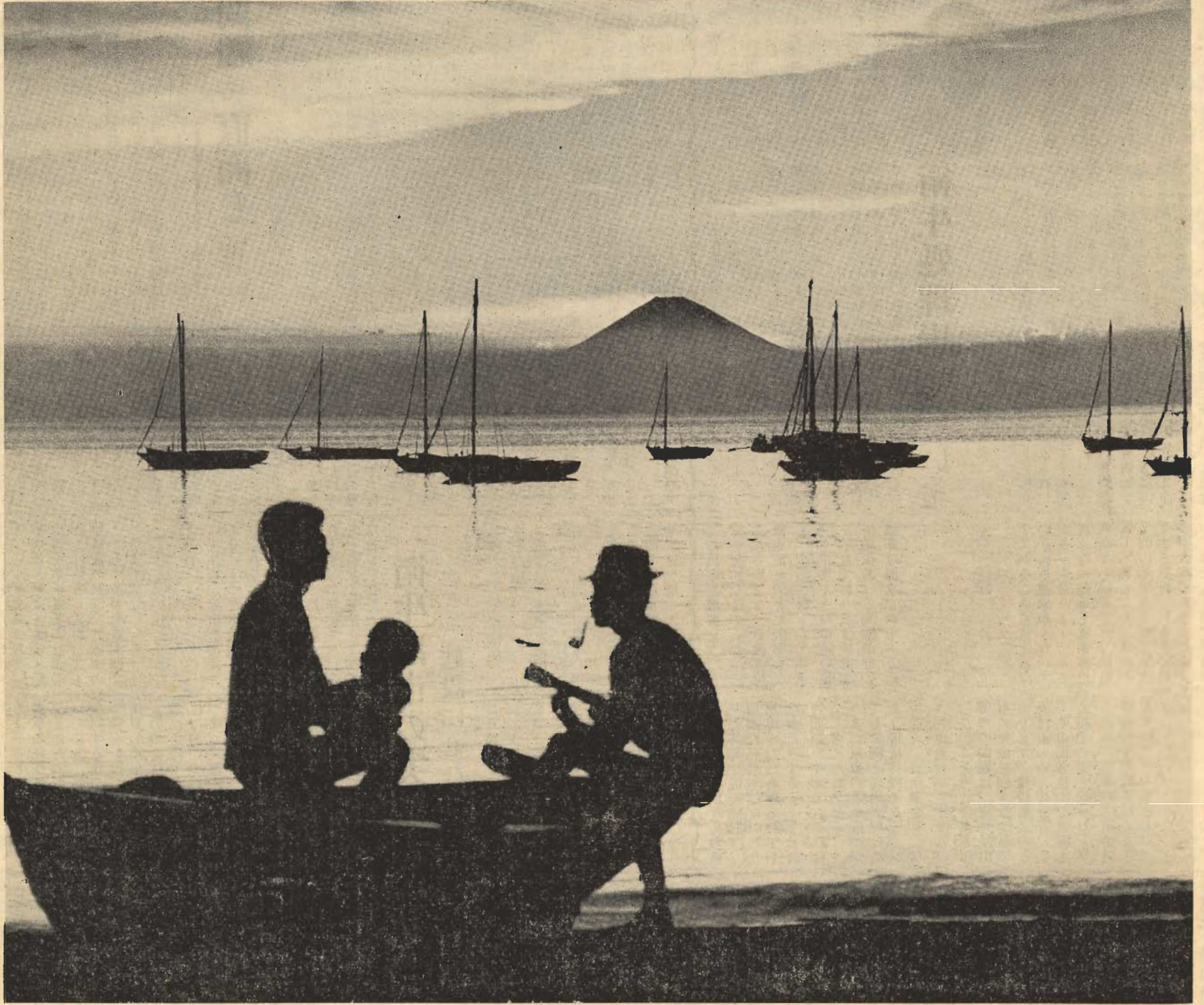
(夕暮れの鏡ヶ浦) =夕やみにウフレレが静かに流れて。