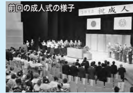
前回の成人式の様子