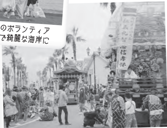
10月 南総里見まつり 伏姫役には「乃木坂46」の高山一実さん