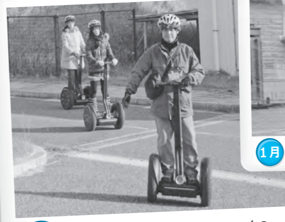
~3月 南房パラダイスでセグウェイの社会実験 延べ約3,000人が体験