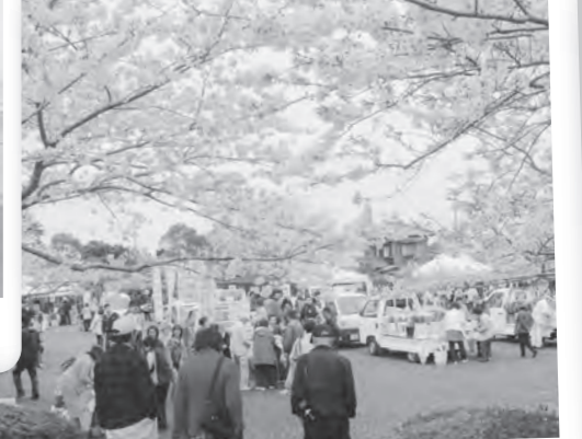
3月 里見桜まつり 桜満開の城山公園 で7,000人が買い物などを楽しむ