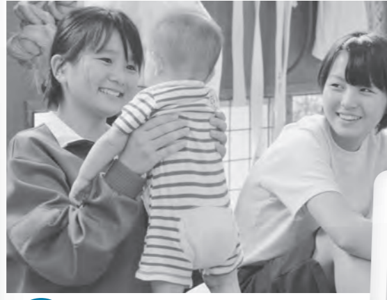
7月 乳幼児と中学生のふれあい体験 “命の尊さ”を実体験で知る