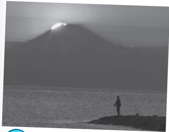
5月 夕景に浮かぶダイヤモンド富士 6月には富士山が「世界文化遺産」に登録