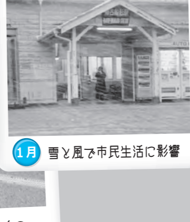
1月 雪と風で市民生活に影響