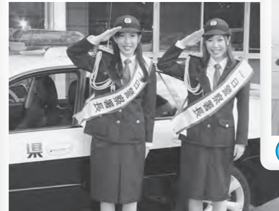
4月 2代目たてやま・ポートシスターズ 一日警察署長に