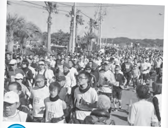
1月 若潮マラソン大会 9,049人が力走！ 申込者数は過去最高