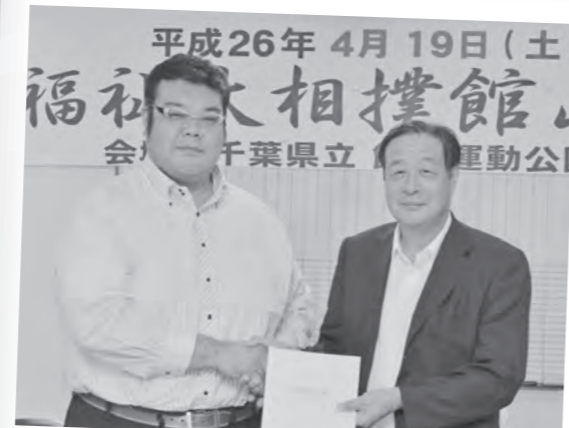
8月 「福祉大相撲館山場所」契約締結 来年4月19日(土)に開催!