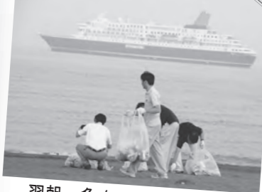
翌朝、多くのボランティア による清掃で綺麗な海岸に