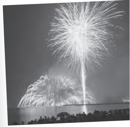
8月 館山湾花火大会 今年も15万人で賑わう