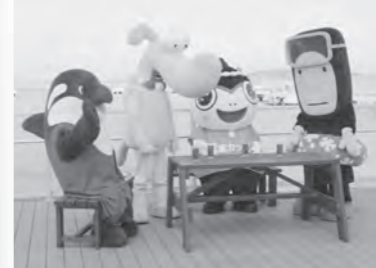
4月 “やるキャラ”対談