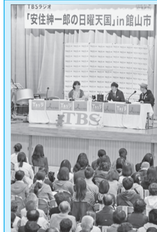
会場を埋め尽くす来場者

安住アナウンサーが事前に2日間市内に滞在し取材した、館山市の紹介や、すし店レポート、沖ノ島からの中継に加え、「2013年館山市びっくりニュースベスト5」が発表されるなど、館山一色の2時間となりました。