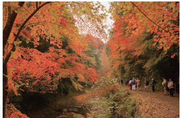
▲君津市亀山周辺の紅葉（過去状況）

そ の 他：市大型バスには乗車定員がありますので、申込者が45人を超えた場合は締め切ります。雨天の場合は中止します。前日の午後5時までに態度を決定する予定です。