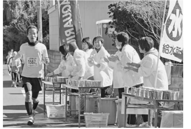
▲前回大会の給水ボランティアの様子

定員/80人(先着順) 申込方法/参加申込書に記入の上、①郵送、②FAX、③持参、④Eメールのいずれかで申し込んでください。 ※参加申込書はスポーツ課にあります。また、大会ホームページ(http://tateyama-wakasio.jp/)からダウンロードできます。 申込締切/12月13日(金) 申込み・問合せ/〒294-8601 北条1-1-45 館山若潮マラソン大会事務局(スポーツ課内) (☎22-3696、FAX 23-3115、Eメール sportska@city.tateyama.chiba.jp)