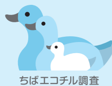
ちばエコチル調査

エコチル調査「子どもの健康と環境に関する全国調査」は、身のまわりの化学物質などが子どもの健康におよぼす影響を調べ、健やかに過ごせる環境づくりを目指す環境省の全国調査で、