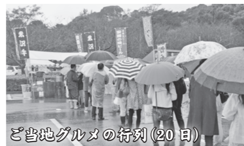
ご当地グルメの行列(20日)