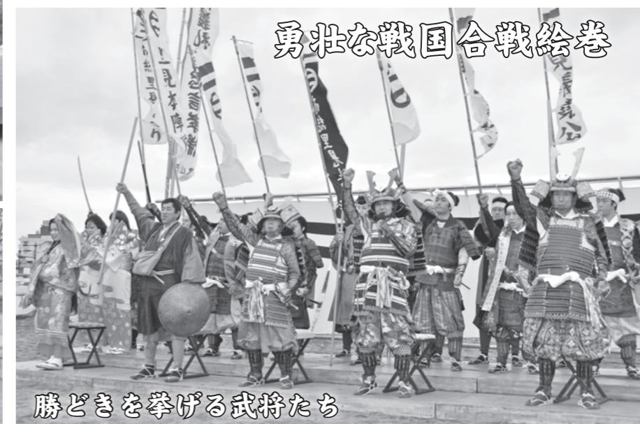
勇壮な戦国合戦絵巻