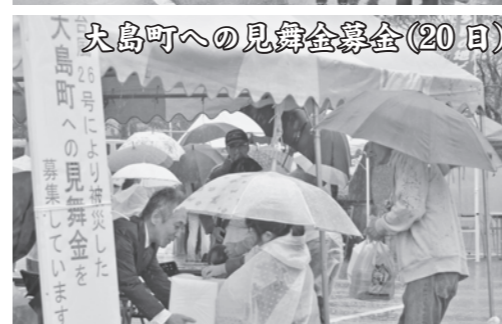
大島町への見舞金募金(20日)