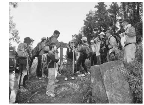
▼昨年実施した山登りの様子

館山周辺の豊かな自然を体感してもらう親子参加型講座「たてやまワクワク探検隊」。今回は、「広場登山クラブ」のメンバーを講師に迎え、「海・山」などの自然が満喫できる南房総市白浜の「城山(標高150メートル)」のコース約5キロメートルを歩きます。 日時/11月9日(土) 午前9時30分〜午後1時 集合場所/南房総市白浜地域センター(旧白浜町役場)駐車場 対象/幼稚園・小学生とその保護者20組程度(申込み多数の場合は抽選) 参加費/一人あたり25円(傷害保険料として) 申込締切/10月31日(木) 申込み・問合せ/中央公民館(☎23-3111)