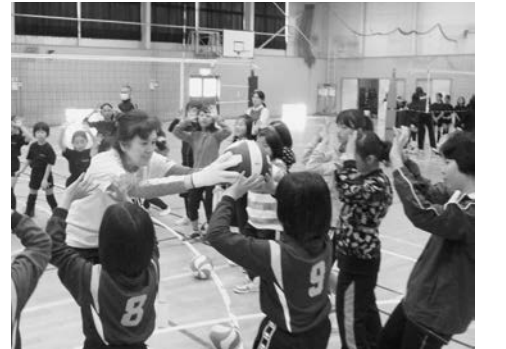
▼昨年実施した同教室の様子