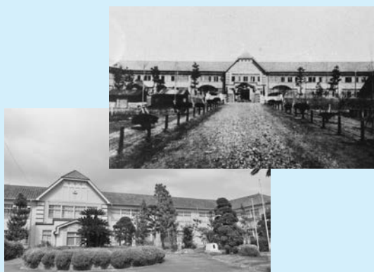
▲(上)昭和6年撮影、(下)現在の旧校舎

県では、郷土の文化財に対する理解を深めるとともに、それを守り、受け継いでゆく心を育むため、県指定有形文化財である「千葉県立安房南高等学校 旧第一校舎」を一般公開します。