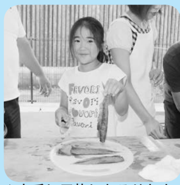
▲上手に三枚におろせたよ

「渚の駅」たてやまでは、夏休み特別企画で、海の魅力にふれあう機会として、館山で水揚げされた新鮮なサバで干物を作る体験教室「渚の教室」サバのみりん干し。館山湾が育んだ魚をおいしくいただきます！を開催しました。 講師が包丁の持ち方や魚の捌き方を説明して教室がスタート。まず、サバの切り身をつけ置きするための塩水を作りました。塩水には昆布だしを入れてひと工夫。講師のお手本を見てから、参加者は包丁を握りました。自分の手でサバの内臓を取り除き、頭を落し三枚におろしました。おろした切り身は、みりん、