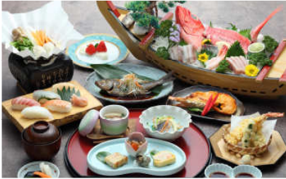
豪快な海の味わいを