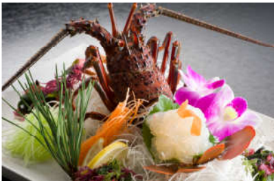
甘みがぎゅっつまった「伊勢えびのお造り」