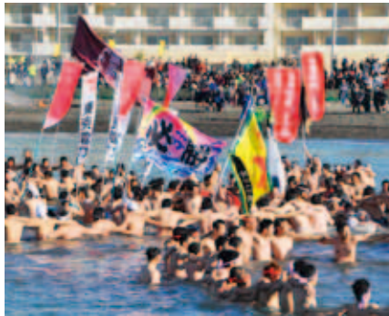
▲昨年の寒中水泳大会

申込方法／【中高生】各学校を通じて申し込んでください。【一般人】電話で事前連絡の上、申込書に