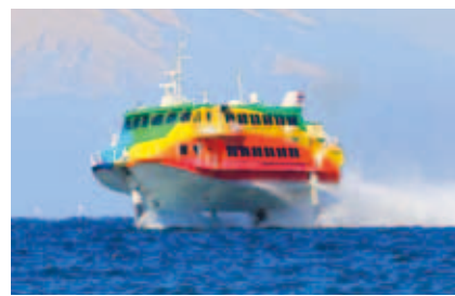
▲高速ジェット船「虹」

【予約について】東海汽船（株）予約センター（☎ 03 - 5472 - 9999）