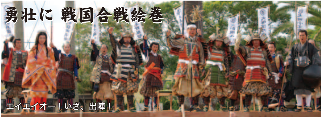
エイエイオー！いざ、出陣！