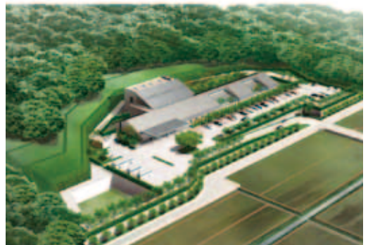
▲平成24年10月に完成予定の新火葬場

応募・問合せ ／〒294-0045 北条420-4 安房郡市広域市町村圏事務組合事務局事業係 (☎22-5633、FAX23-9155、Eメール jimukyoku03@awakouiki.jp)