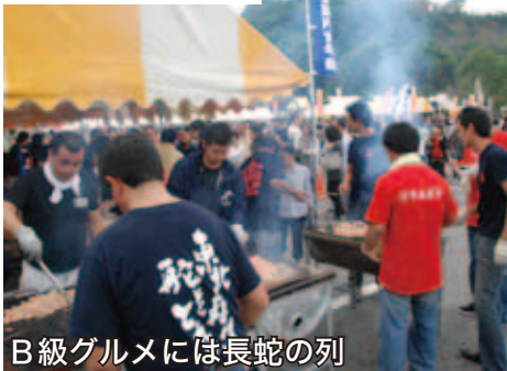
B 級グルメには長蛇の列