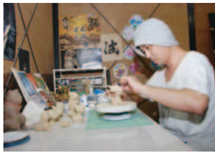
▲被災地の子どもたちと、支援に携わるみんなを笑顔でつなぐ『わらいねこ』を作成中

東日本大震災の後、宮城県仙台市や岩手県大船渡市の保育園などを訪ね、約300人の子どもたちと一緒に絵を描きました。子どもたちの笑顔で自分が役に立つことを教えられたそうです。