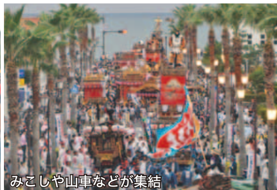
みこしや山車などが集結