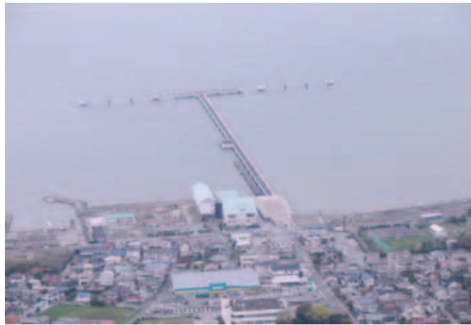
▲愛称を募集する「館山港多目的観光棧橋」

現在、棧橋のたもとでは、平成24年3月の完成を目指し、ターミナル機能を合わせ持つ海辺の交流拠点施設「渚の駅」たてやま」の整備が進められています。市では、「渚の駅」たてやま」と「館山港多目的観光棧橋」が一体となった活用を目指しています。この