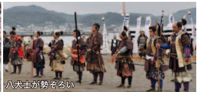
八犬士が勢ぞろい