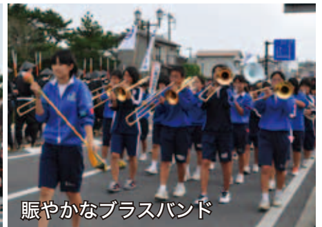
賑やかなブラスバンド