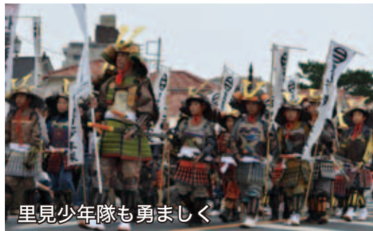
里見少年隊も勇ましく