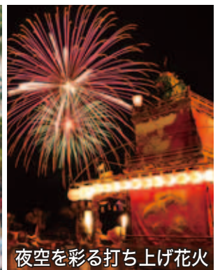
夜空を彩る打ち上げ花火