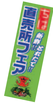
▲こののぼり旗が目印

フェアには、市内12か所の直売所をはじめ、県内140か所の直売所が参加。期間中はスタンラリーによる抽選プレゼント、直売所独自のイベントなどを開催し