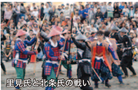
里見氏と北条氏の戦い