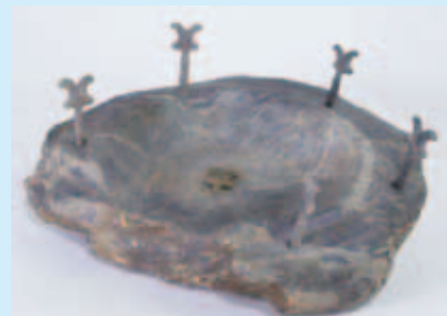
▲上赤塚1号墳(千葉市)出土の石枕