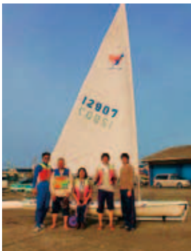
▲平成23年5月4日 館山総合高校 ヨットハーバーにて

初心者の方、大歓迎！さわやかな海風を肌で感じながら、ヨット体験をしませんか？ 指導者が優しく指導します。