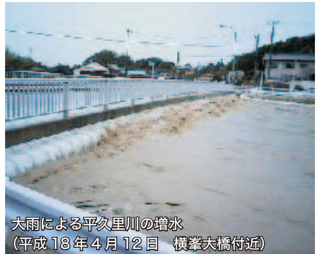
大雨による平久里川の増水 (平成18年4月12日 横峯大橋付近)

これから台風や大雨のシーズンを迎え、洪水やがけ崩れ、暴風による家屋の損壊など、大きな被害が発生するおそれがあります。被害を最小限にするためにも、日ごろからの備えが大切です。