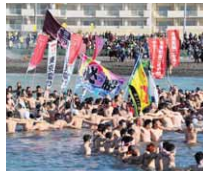
▲今年の寒中水泳大会