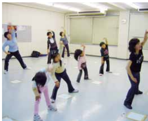
▲リズム&ストレッチ