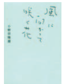
『風に向かって咲く花』

館山商工会議所発行の「館山会議所だより」と館山公共職業安定所発行の「ハローワーク情報」「ハローワーク求人情報」が図書館でご覧いただけるようになりました。「ハローワーク求人情報」は配布もしています。仕事探しや地元の商工業情報を知りたいときに、図書館の本と合わせてお役立てください。