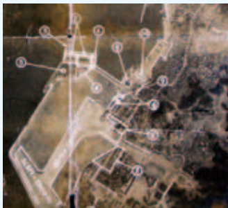
▲米軍撮影航空写真(館山海軍航空基地部分)

同機が持ち帰った7000枚以上の鮮明な航空写真が、以後の空襲の参考資料となり、同11月24日にB・29が初めて東京を空襲するまで、偵察飛行は延べ17回実施されました。米軍の動きに旧日本軍も対応し、B・29の東京初空襲に