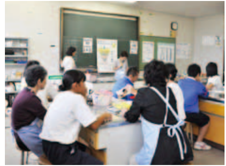
▼食事バランスガイドの活用法を中学生へ伝授