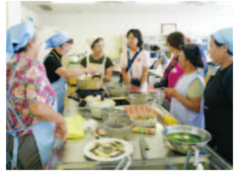
▲おらがごっつお（郷土料理）の伝承

ヘルスサポーター21事業（生活習慣病予防教室）の開催 郷土料理「おらがごっつお（我が家のごちそう）」の伝達 親子クッキング、離乳食学級、ハッピーファミリーへの協力 乳幼児や高齢者の家庭訪問