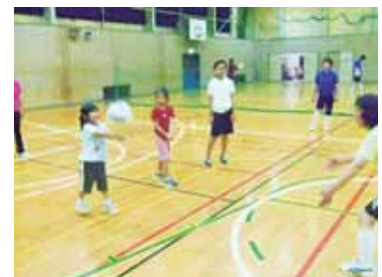
▲ソフトバレーボール

バドミントンコートを使い、ネットの高さは2mです。普通のバレーボールよりも大きく、柔らかいボールを使うので、痛くありません。初心者や高齢者の方でも楽しめます。