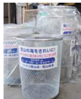
▲寄贈されたごみかご