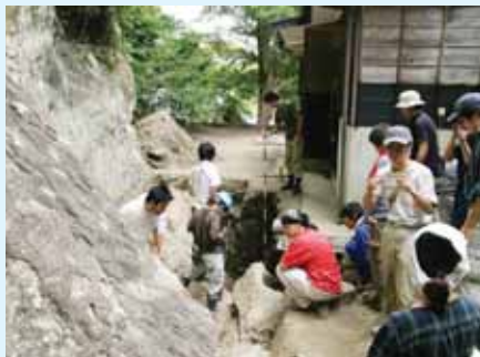
▲平成20年の発掘調査の様子

弥生時代の抜歯人骨が出土した洞窟遺跡として、考古学界の評価が定着した安房神社洞窟遺跡。昭和42(1967)年には千葉県史跡に指定されました。