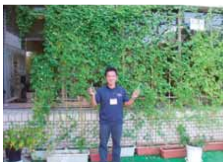
【中央公民館にて昨年撮影】