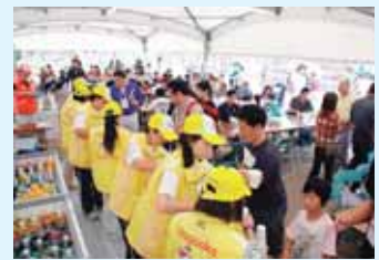
▲新潟国体での休憩所の様子

ゆめ半島千葉国体館山市実行委員会（館山市教育委員会 国体推進課内） 〒294-8601 館山市北条1145-1 TEL：22-3957 FAX：23-3115 E-mail：kokutai@city.tateyama.chiba.jp