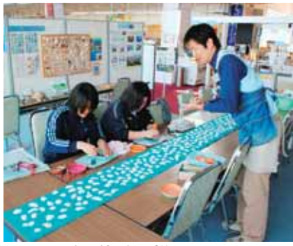
▲貝みがき体験の様子