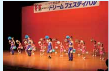
▲他会場でのイメージソングダンス風景

このコンテストは、9月25日(土)千葉マリスタジアムで開催するゆめ半島千葉国体開会式オープニングプログラムでイメージソングダンスを踊っていただくチームを決めるものです。37年ぶりに千葉県で開催される国体にダンスで参加してみませんか？