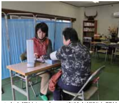
▲老人福祉センターで高齢者相談も開始

「近所に困っているお年寄りがいる」あるいは、「一人暮らしのお年寄りを訪ねたら寝込んでしまっていた。どうしたらよいかわからない」という場面に遭遇したとき、包括支援センターへの情報