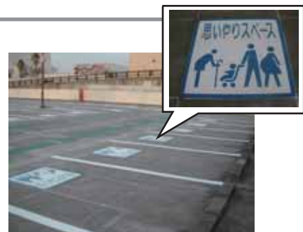
▲新たに設置された『思いやりスペース』