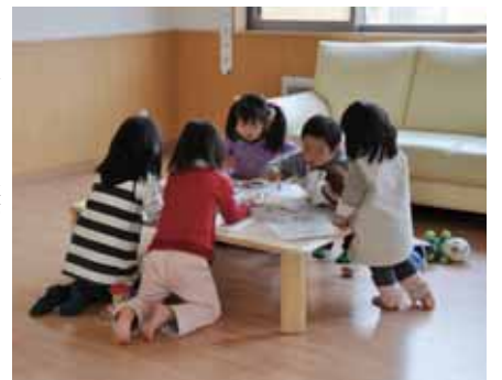
▲遊びながら成長します