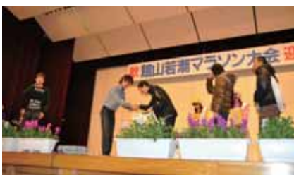
ゲストによる豪華賞品の抽選

豪華な賞品が当たるプレゼント抽選会も行われ、当選番号が読み上げられると会場から歓声が上がっていました。