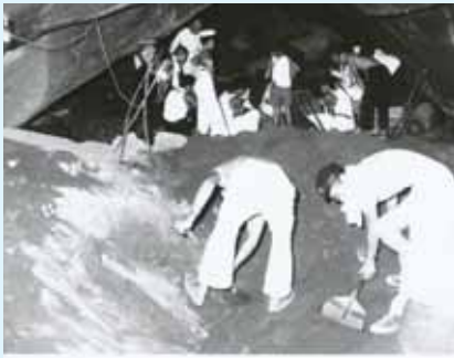
▲昭和31年の発掘調査

館山市沼の大寺山洞窟遺跡は、館山湾を一望できる丘陵の先端にあり、「沼の大寺」として親しまれる総持院の裏山にあります。この遺跡は3つの洞窟からなり、西に向けて垂直に切り立った山裾に口を開けています。