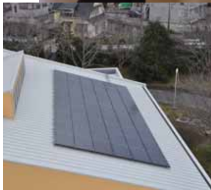
▲屋根には太陽光発電設備を設置

ています。利用には会員登録が必要で、費用もかかりますが「安心して子どもを預けられる」と好評を得ています。