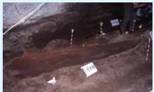
▲舟棺が見つかった様子

解明が、長い空白期を経て平成4(1992)年に再開されました。千葉大学文学部考古学研究室を中心に平成10年までの間に、7次に及ぶ発掘調査が行われました。