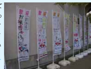
▲手作りのぼり旗による応援

ゆめ半島千葉国体館山市実行委員会(館山市教育委員会 国体推進課内) 〒294-8601 館山市北条1145-1 ☎22-3957 FAX:23-3115