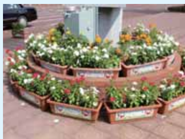
▲おもてなしの花による歓迎

トキめき新潟国体の軟式野球競技は5市で開催されました。館山市では五泉市を中心に、会場での競技運営、おもてなしや市民ボランティアなどの様子を調査してきました。競技団体・市民・関係団体が一体となり、競技会を運営している姿は大変参考になりました。