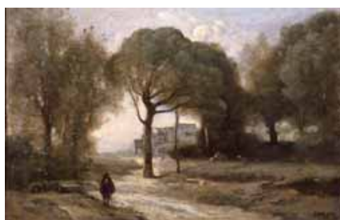
▲カミーユ・コロール「ナポリ近郊の思い出」