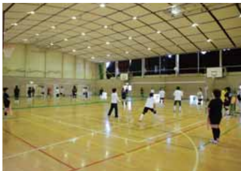
▲ 40周年記念親善軽スポーツ大会の様子

女性も増え、時間を確保するのが難しくなったのか、団員も次第に減少してきています。が、今でも情熱を燃やし、活動を続けている仲間がクラブを支えてくれているそうです。