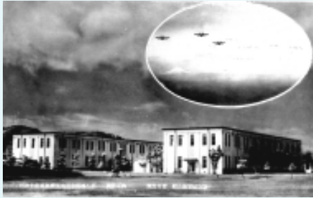
▲館山海軍航空隊の兵舎。左側が、現在の教育史料館と思われる。

かつての館山海軍航空隊の鉄筋コンクリート3階建て本部庁舎は、戦時中の空襲で大きく破損しましたが、今も海上自衛隊第21航空群司令部庁舎と