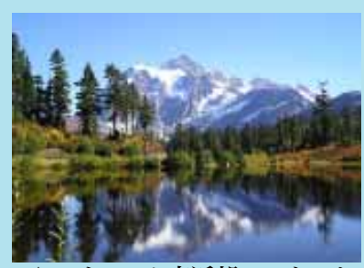
▲ベリンハム市近郊のマウント・バーカーを望む