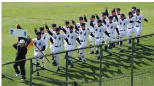
▲堂々とした入場行進

勝利の後、安房高の校歌が甲子園に流れると、スタンドは自然と大合唱に。スタンドに笑顔であいさつにきた選手を迎える大歓声。「よくやった」と選手とともに喜びを爆発させました。