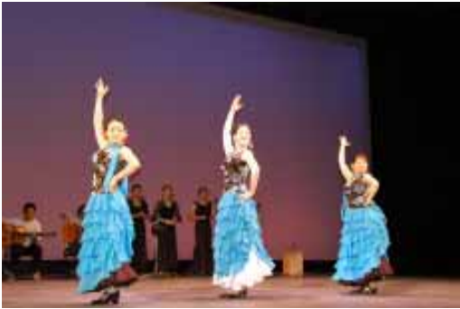
▲フラメンコを踊る大学生（昨年撮影）