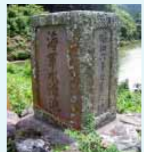
▲土盛式のダムの上に建つ海軍水源池(池)の標柱

海軍の主力は艦船であり、飲料水の確保は今も大きな課題です。旧日本海軍も水源地の確保には精力的に取り組み、広島県の旧呉海軍工廠では、明治23(1890)年以来、