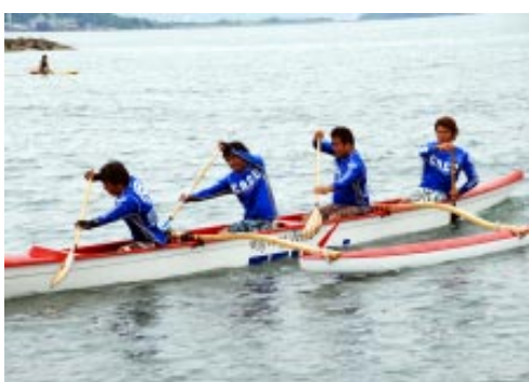
▲アウトリガーカヌーレース

参加費／【団体種目】1チーム2万円【個人種目】ビーチフラッグス 1千円、アウトリガーカヌー 1人1千500円