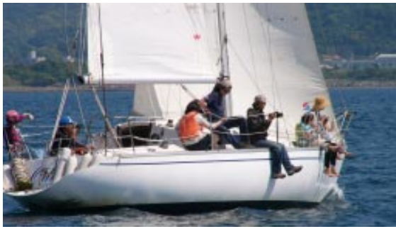
▲ヨットの乗船体験 「たてやま海まちフェスタ2007」にて

「クラブでは、今年、ゴールデンウィークに、館山湾を会場としてヨットレース『パシフィック リム ヨット チャレンジ』Tateyama2008』を開催します。