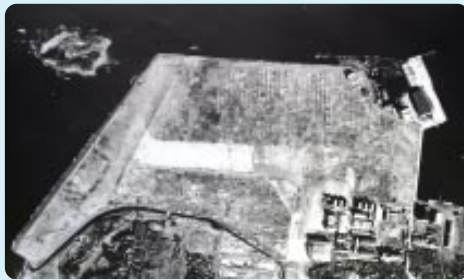
▲館山海軍航空隊跡の航空写真 (昭和22年撮影)

かつて館山海軍航空隊が置かれた基地の周辺には、工場や倉庫、戦闘機を空襲から守るための掩体、地下壕など、さ