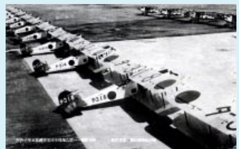
▲館山海軍航空隊に配備された89式艦上攻撃機

昭和5(1930)年、5番目の海軍航空隊として開設された館山海軍航空隊の建設工事は、大正12年の関東大震災による地盤隆起により、宮城・笠名海岸と沖ノ島・鷹ノ島を