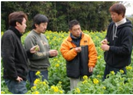
▲館山体験ツアーに備えて先輩移住者と打ち合わせするおせっ会のメンバー

館山への移住を希望する方の気軽な相談相手になってあげたい。市民のネットワークが移住者を囲み、温かく迎えてあげたい。そんな思いから定住・移住促進市民ネットワーク「おせっ会」が誕生しました。 「リゾートマンションの建設ラッシュを見てわかるように、館山に移り住もうと考えている方が増えています。団塊の世代を中心とした「田舎暮らし」ブームだけでなく、都会との2拠点居住や子育ての地としても、館山は地元住民が考えている以上に魅力的なまちということです。ただ、移住を希望される方