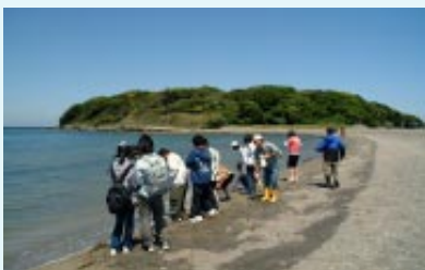
▲自然ガイドと探検に出発

館山湾の沖ノ島は砂州で陸続きになっている周囲1Kmほどの無人島。自然ガイドの案内で、砂浜に打ちあがった貝殻やビーチグラスなど、海からの贈り物を拾い集めるビーチコーミングや磯の生物観察などを楽しみます。