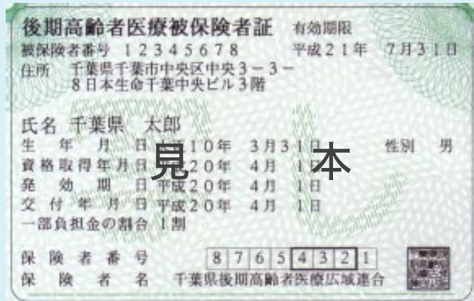
▲一人ひとりに送られる後期高齢者医療被保険者証

千葉県の後期高齢者医療では、保健事業として、被保険者の健康の保持増進のため、健康診査を実施します。従来の総合検診と同様、市が健康診査を行います。