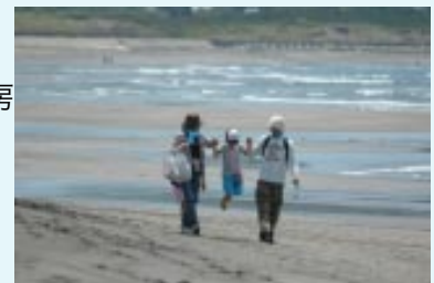
▲砂浜の感触、海風を体感