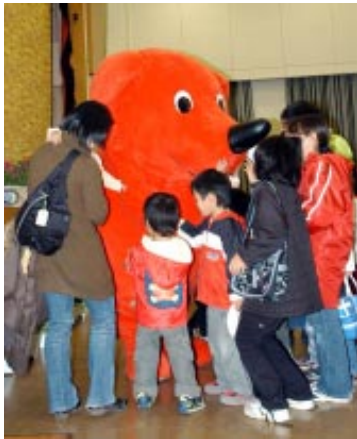
▲国体をPRするチーバくん

コースや走り方について アドバイスがありました。豪華な賞品が当たる プレゼント抽選会も行われ、当選番号が読み上げ られると会場から歓声があ がっていました。