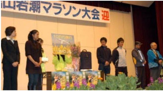
▲ゲストランナーらが豪華商品を抽選