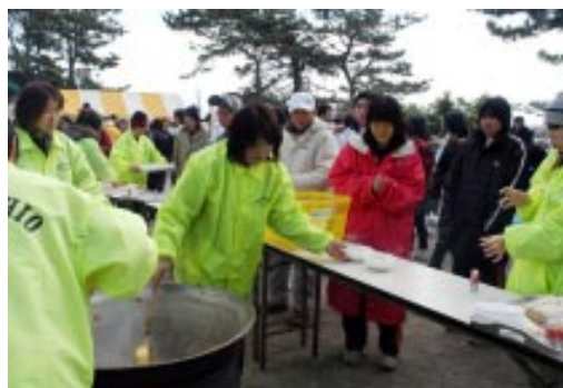
▲会場では温かいトン汁のサービス