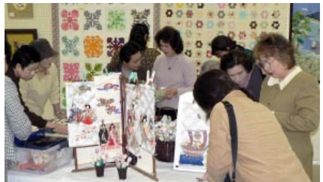
▲昨年のサークルフェスティバル