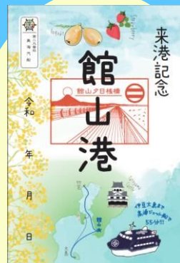
オリジナル御船印紙付 (イメージ)