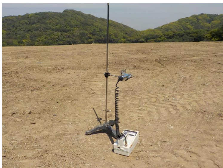
地上高 50cm 地点