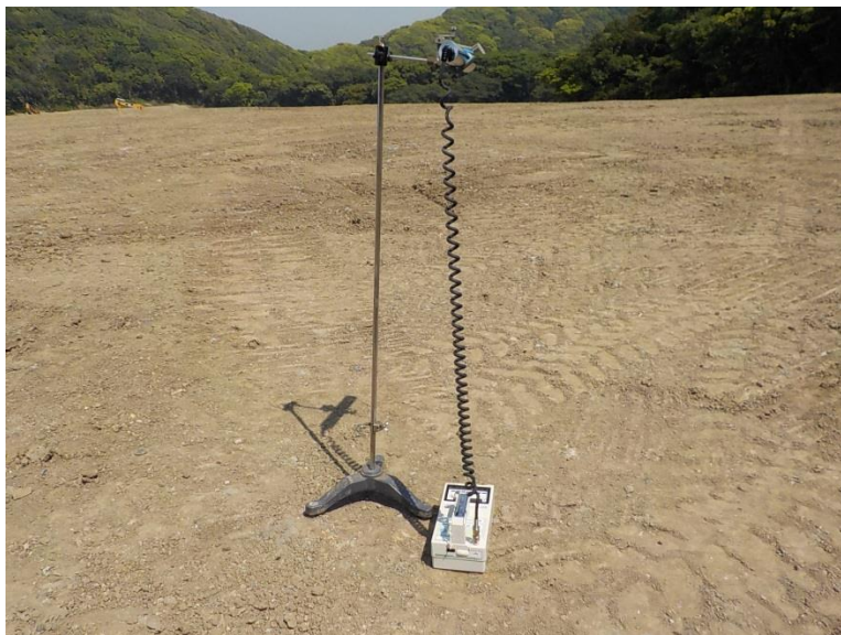
地上高 1 m地点