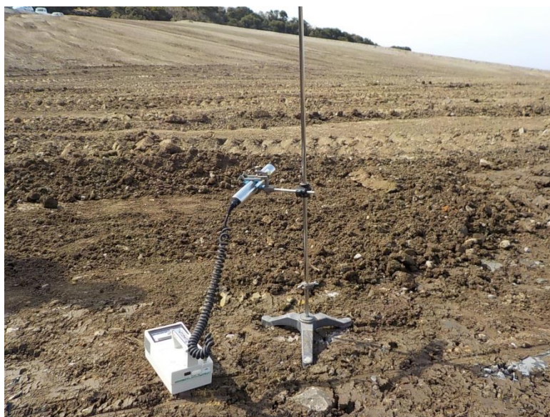
地上高 50cm 地点