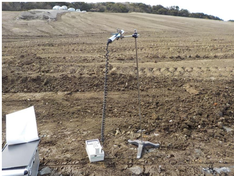
地上高 1 m地点