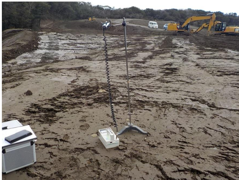
地上高 1 m地点