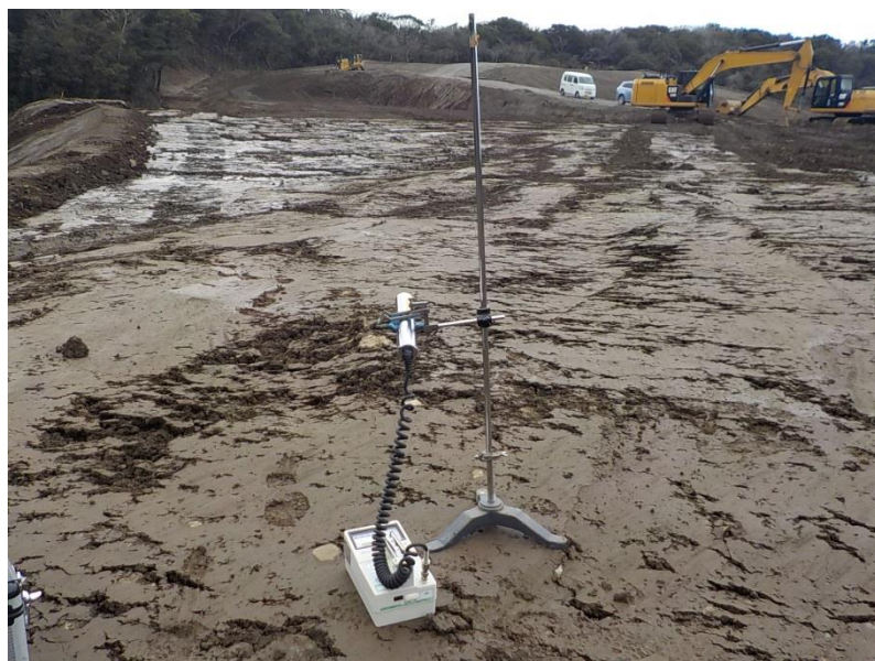
地上高 50cm 地点