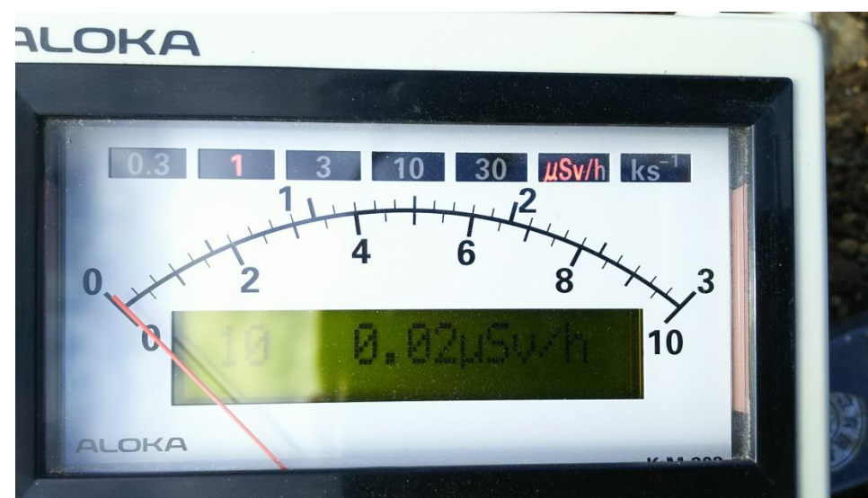
地上高 1 m地点 測定値 (平均値)