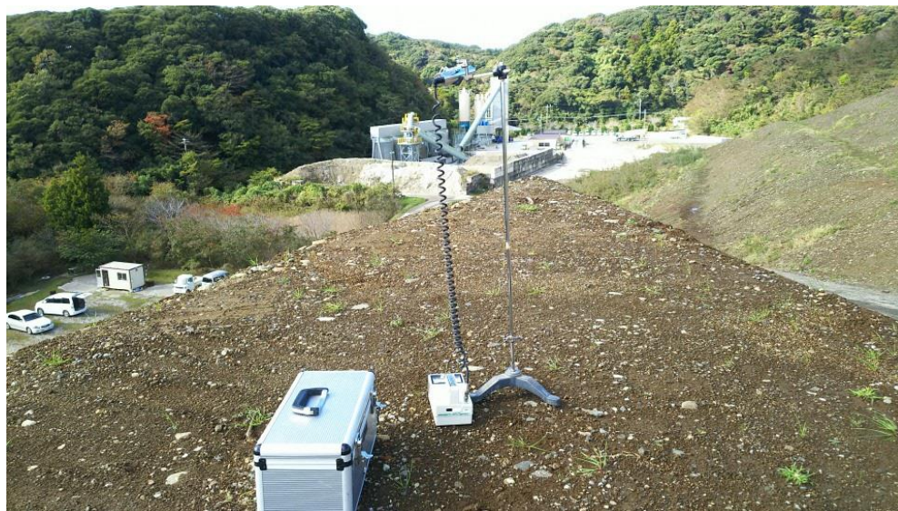
地上高 1 m地点