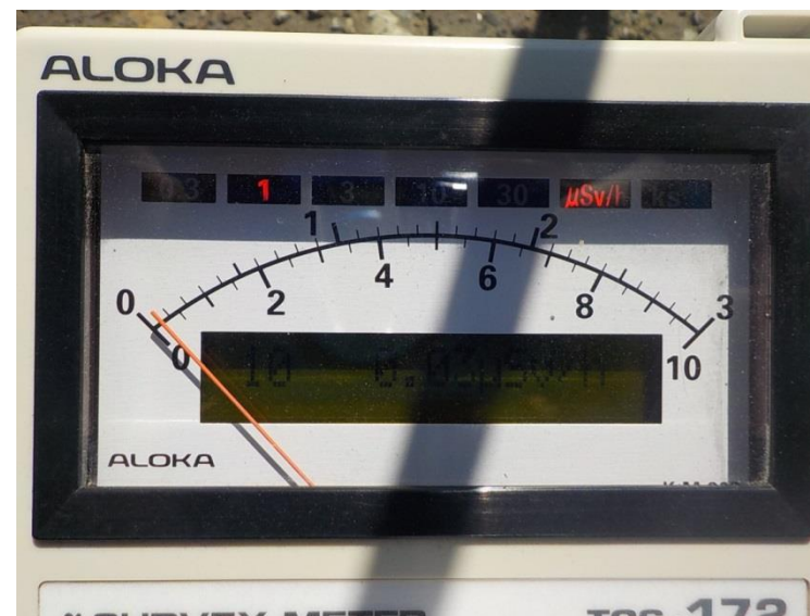
地上高 1 m地点 測定値 (平均値)