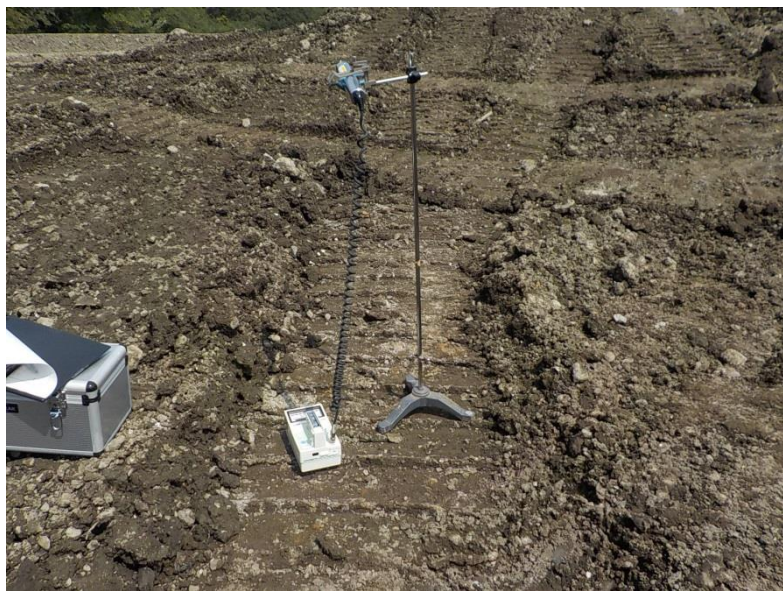
地上高 1 m地点