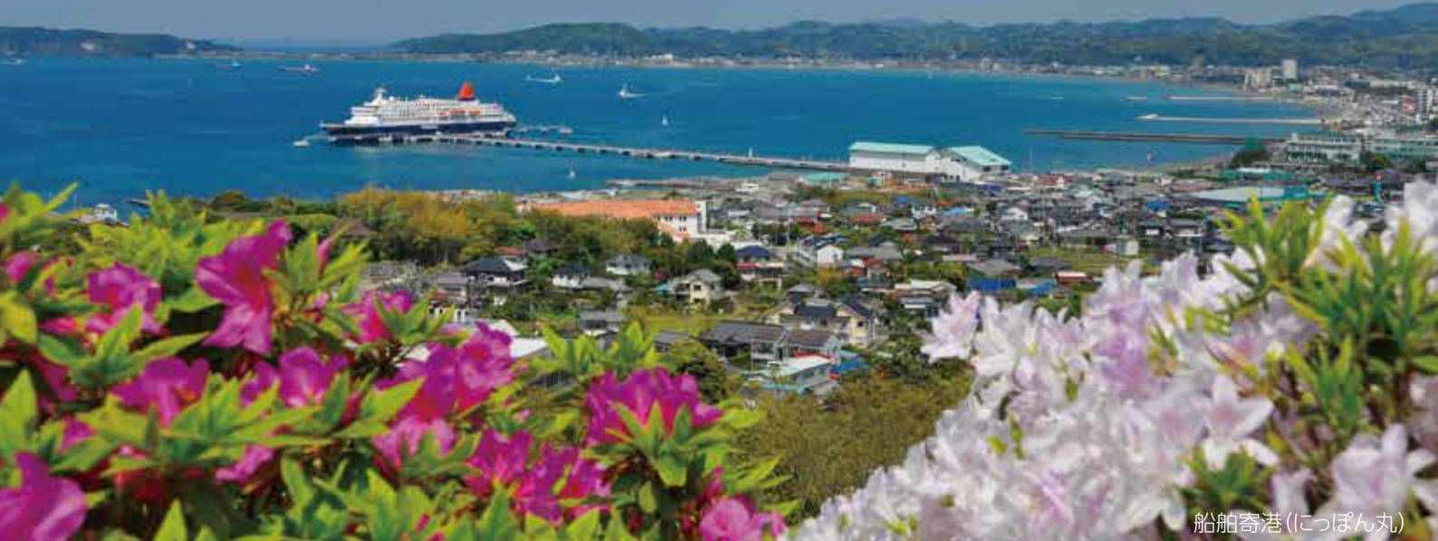
船舶寄港(にっぽん丸)