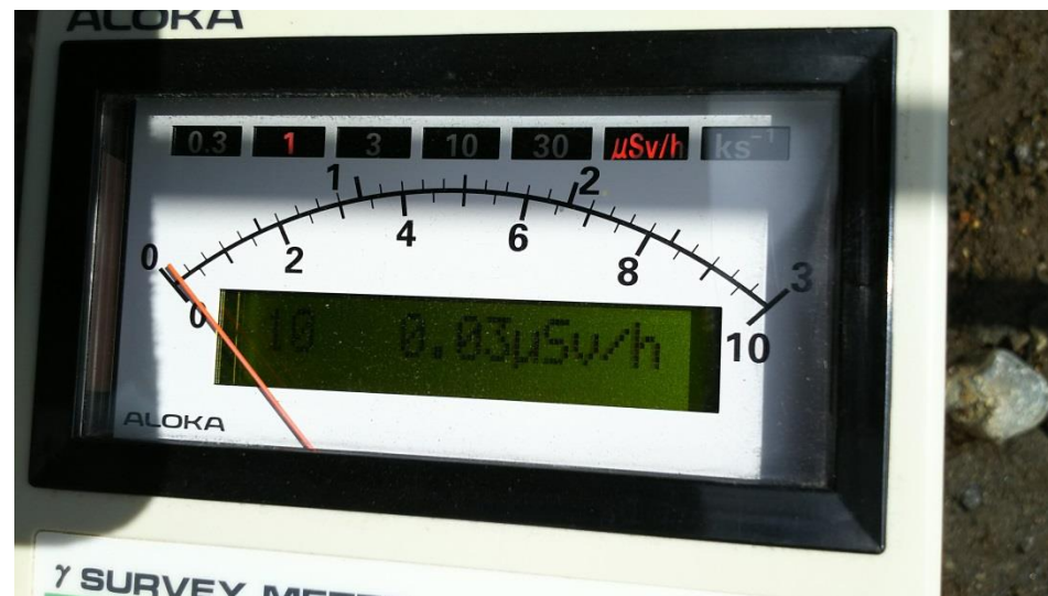
地上高 1 m地点 測定値 (平均値)