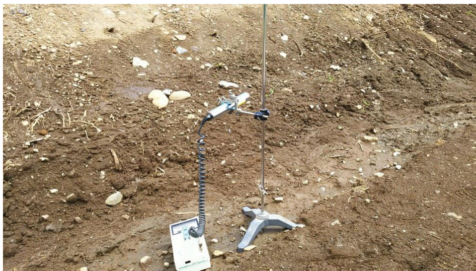
地上高 50cm 地点