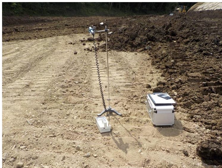
地上高 1 m地点