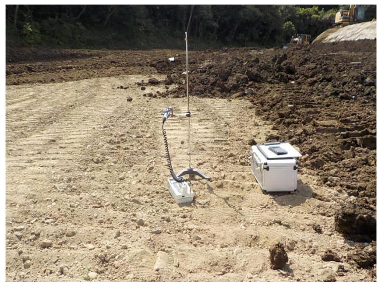
地上高 50cm 地点