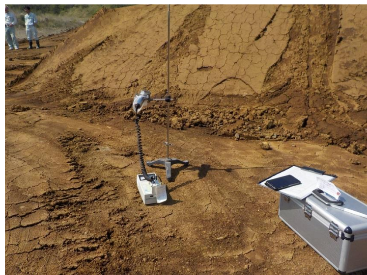
地上高 50cm 地点