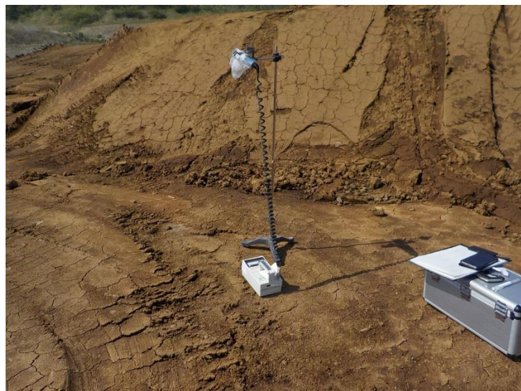
地上高 1 m地点