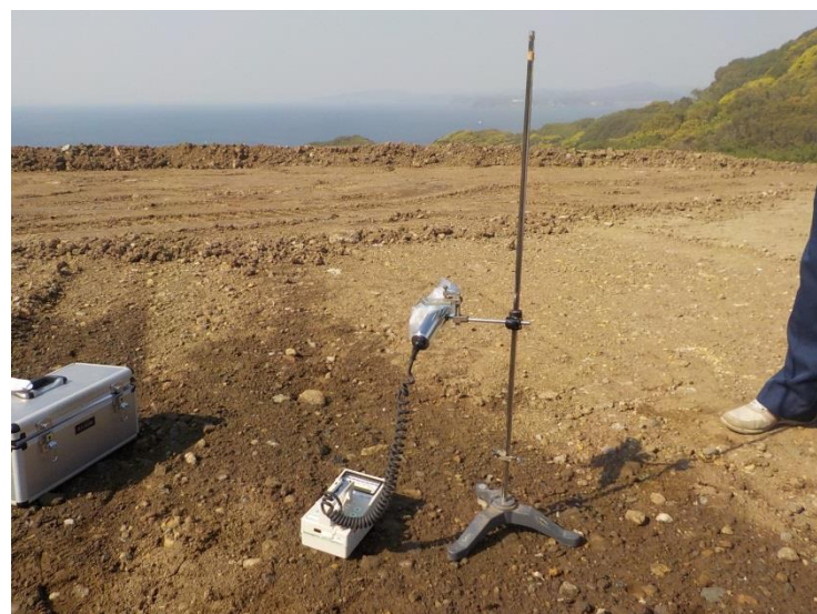
地上高 50cm 地点