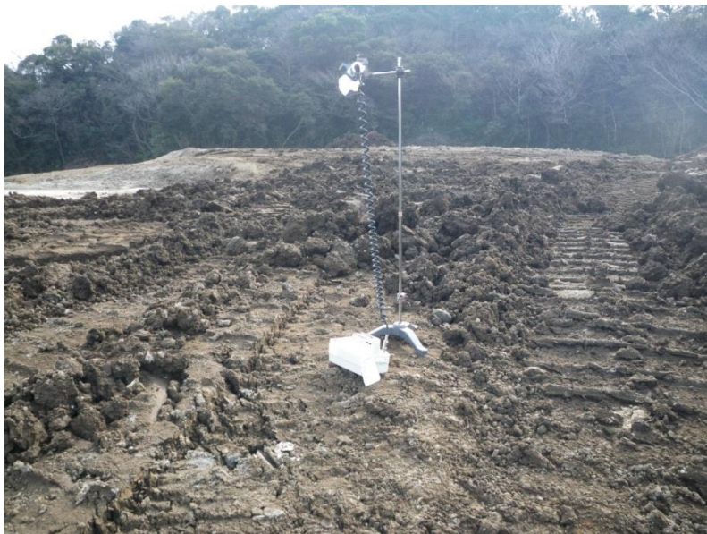
地上高 1 m地点