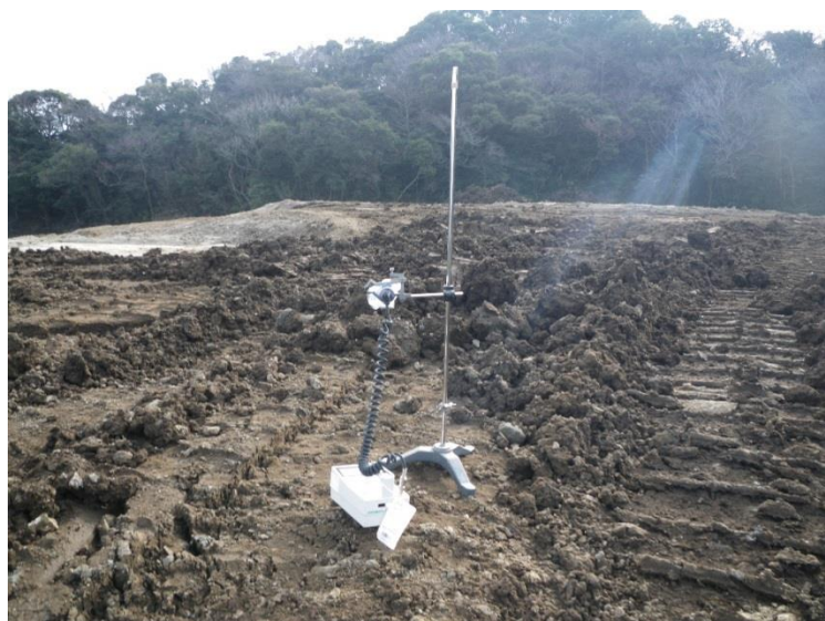
地上高 50cm 地点