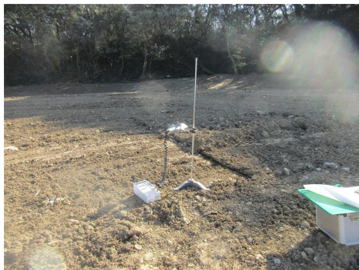
地上高 50cm 地点