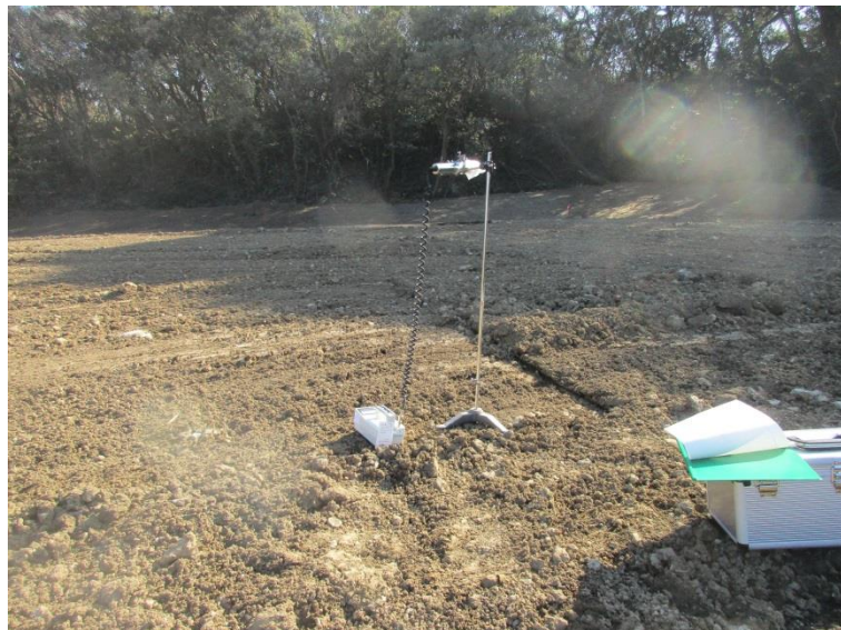
地上高 1 m地点