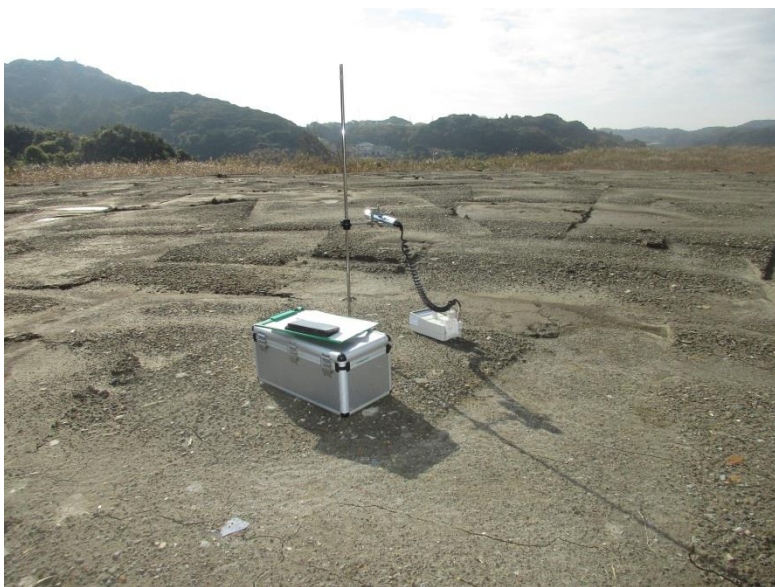
地上高 50cm 地点