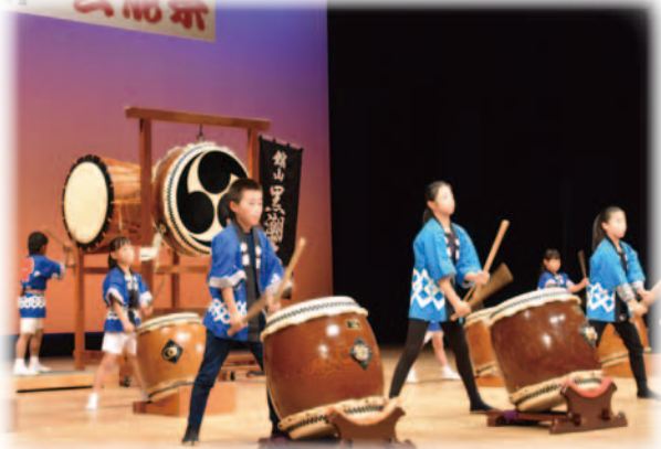
創作太鼓を披露する館山黒潮太鼓のこども達

現在、市内には10の地区委員会があり、球技大会や芸能祭、保健事業、さらには、地域の生活課題の解決等、幅広く活動しています。