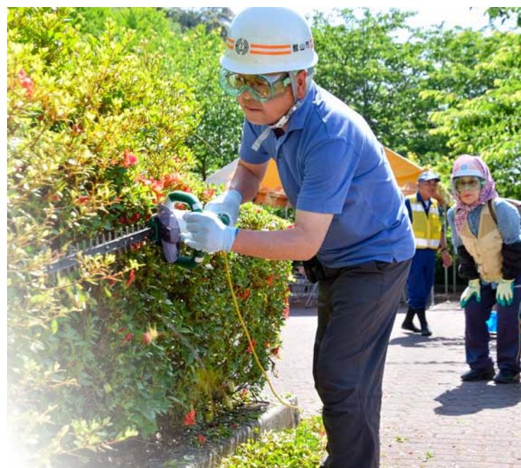
6月のツツジ・サツキ 剪定講座の様子