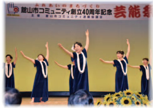
市歌「わがまち館山」をフラダンスで表現

芸能祭では、各地区から自慢の舞踊、太鼓、民謡など、50を超える演目が披露され、大いに盛り上がり、参加者は地区の垣根を越え親睦を深めました。