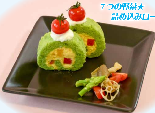
7つの野菜★ 詰め込みロールケーキ (島田さちさん)