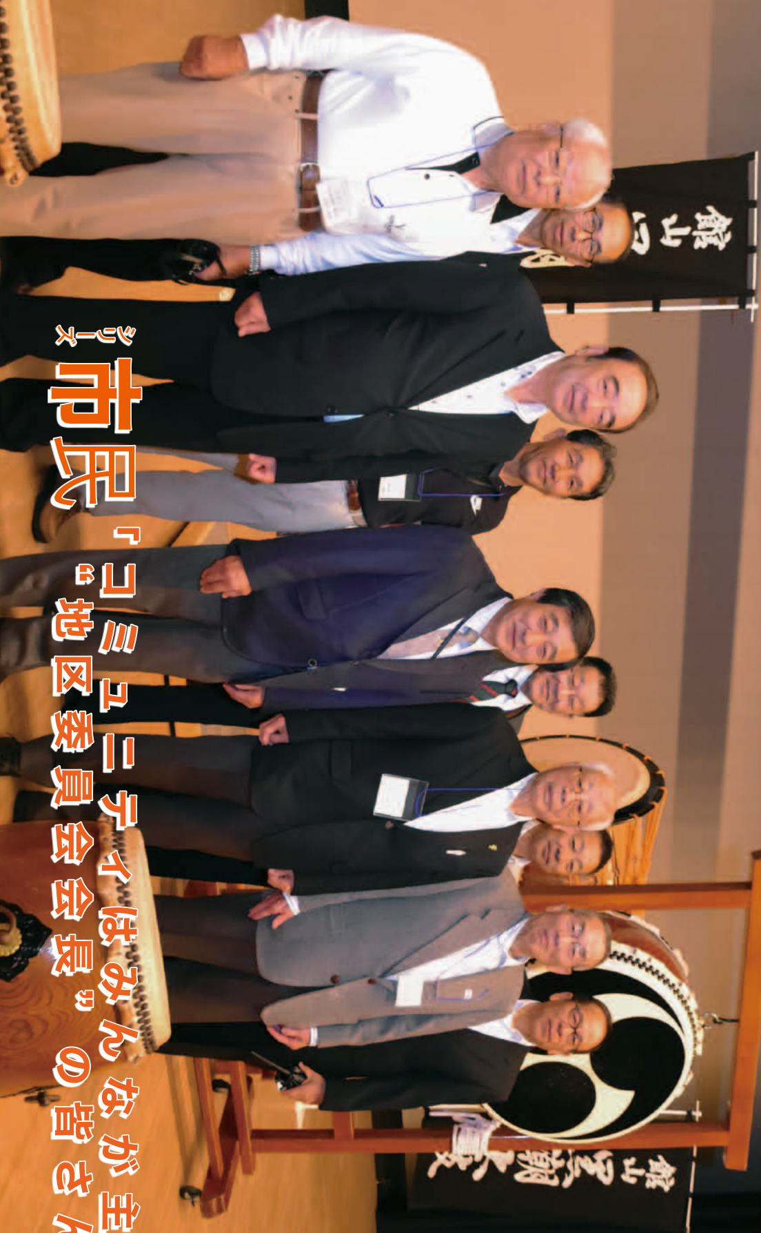
市民「コミュニティはみんなが主役」の皆さん